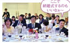
ここで結婚式するのもいいな〜

りゲストとなつて楽しい時間を共有することを目指しました。そして当日、祝賀会で従業員の家族に見てもらうために、職場の仲間が紹介動画を作成して上映。家族にとっては家では見せない顔が新鮮だったかも知れません。そして従業員が選ぶ、頑張っている人の表彰式、表彰状に書かれた「あなたはすごい」にみんな爆笑。副賞のお米30kgもウケました。祝賀会の終わりにには未