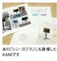
あの「シン・ゴジラ」にも登場したKANIです

が多かった記念式典も、全員参加で記憶に残る1日となりました。裏面「スペシャル・リポート」もぜひ。