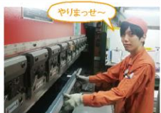
プレーキプレスという設備を使って試作品を曲げています