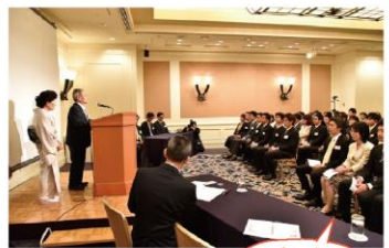
式典ではこれまでの一ノ坪製作所の歴史を振り返るビデオも鑑賞

この6月2日(土)、帝国ホテル大阪にて「創業70周年記念式典、祝賀会」を開催しました。参加は従業員とその家族約190名、これを節目に10年、20年先に向けてよりいっそう一丸となるために、同じ時間を共有して記憶に残る記念式典にする、とい