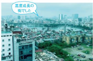
高度成長の街でした

おなじみ、KANIカタログをリニューアルしました。拡充アイテムを追加した、新カタログにご期待ください。今回はオプション追加がメインですが、次号では新製品を掲載予定です。どうぞご期待ください。