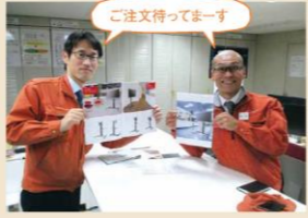
ご注文待ってまーす

当社では、立ち会議を積極的にしています。立っことによって、省スペースでの会議が可能となり、会議時間も短縮されます。また、座っているよりも机に近づくと、皆の距離が