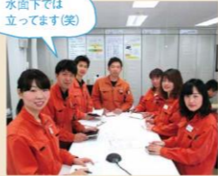
水面下では立ってます(笑)

今年60期を迎える創立記念日に合わせて、初の「社内技能オリンピック」を開催します。「競技の模様を動画で配信したい」「会場に家族を呼びたい」など、すでに企画段階で夢が広がっております。日ごろの業務で培った技術で、社内200名を目指します。必ず良い仕事に繋がります。お客様の笑顔と結びつく信じ、選手(従業員)同全力で取り組みます。