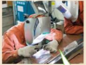
タイムと見ばえを競いあえ!

1年半ぶりに「KAN-1」カタログをリニューアルしました。大きなリニューアルを増やした新製品も掲載し、今後もシリーズの充実を目指します。ご注文ならびに「こんなのでけへん?」などのご意見もお待ちしております。