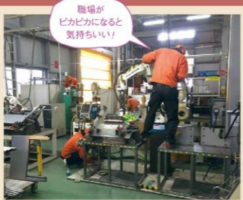
職場がピカピカになると気持ちいい!

社内の改善活動として、毎週末に30分、全員で行う5S活動を始めました。清掃用品も新たに用意し、不要品の整理や設備の清掃を中心に実施しています。「整理・整頓・清掃・清潔・躰」。少しずつで